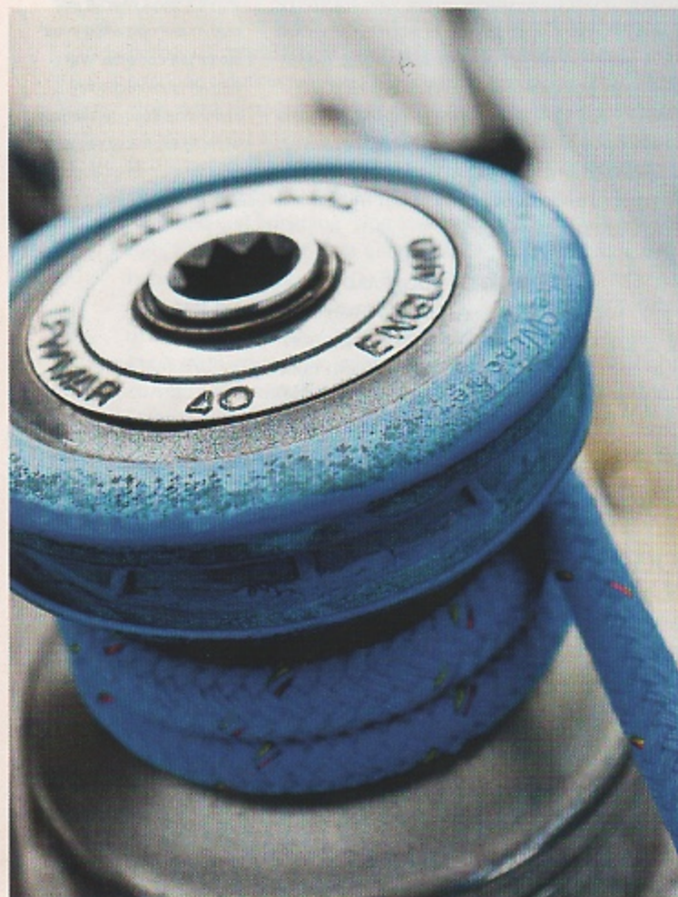
ONDER Kwaliteit tot in de details: op het schip zitten nog de originele lieren.